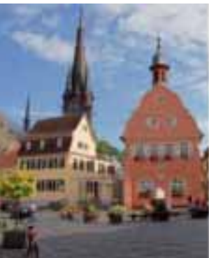
Historischer Marktplatz in Gau-Algesheim mit Rathaus und Kath. Pfarrkirche St. Cosmas und Damian

Start ist am Rathaus/Marktplatz (Tourist-Info) in Gau-Algesheim. Über die Neugasse an der kath. Kirche vorbei biegen Sie nach rechts in die Schlossgasse ein. Am Schloss-Ardeck und Rhein Hessischen Fahrrad-Museum vorbei radeln Sie auf der beschilderten Obstroute (s. S. 26) nach Appenheim und Nieder-Hilbersheim. Vorbei an Pferdekoppeln, Wiesen und romantischen Mühlen fahren Sie im Welzbachtal bis zum höchsten Punkt der Tour nach Ober-Hilbersheim (ca. 260 über NN).