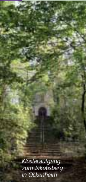
Klosteraufgang zum Jakobsberg in Ockenheim

Start ist in Gau-Algesheim am Rathaus/Marktplatz. Über die Kloppgasse geht es rechts ab in die Schulstraße an der ev. Kirche vorbei. Dabei kreuzen Sie die Ernst-Ludwig-Straße und fahren weiter geradeaus vorbei am Albertus-Stift auf den Radweg. Vor der Brücke biegen Sie rechts ab und fahren ein kurzes steiles Stück bergab bis zum Obsthof Hemmes, dann links weiter über die Landstraße auf den Radweg der Bahnlinie entlang nach Ockenheim.