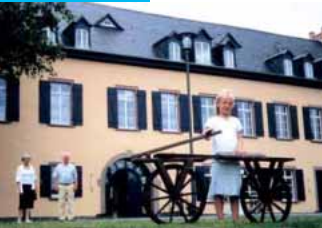
Schloß Ardeck mit Fahrradmuseum