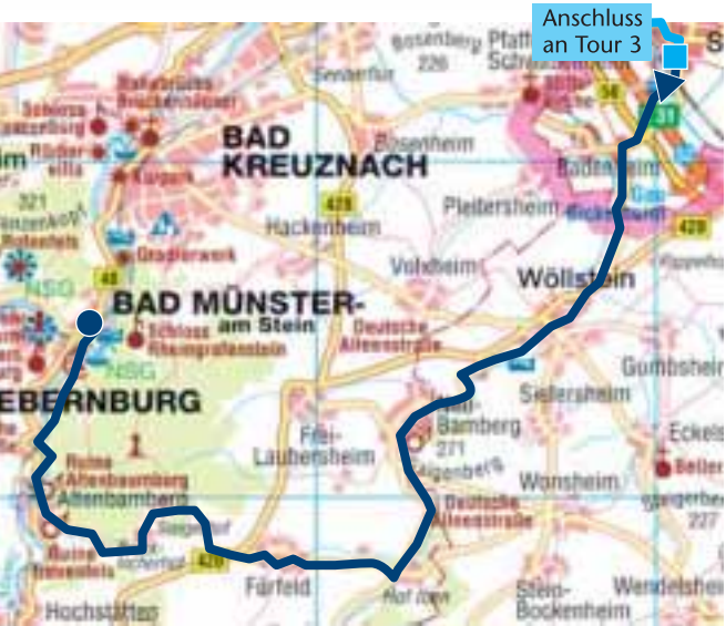
Karte TOUR 4

Dort fahren Sie am Schwimmbad links vorbei und gelangen dann auf dem Radweg über eine ehemalige Bahnbrücke in das wunderschöne Naturschutzgebiet. Genießen Sie hier den Blick in das Appelbachtal, wo einst das „Bawettche“, eine kleine Eisenbahnlinie, von Sprendlingen nach Wöllstein, Neu-Bamberg und Fürfeld fuhr. Weiter geht es an der Ölmühle vorbei, wo man in einem typisch rheinheissischen Innenhof auch eine Pause einlegen kann. Über eine weitere Brücke ge-