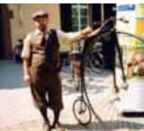
Rhein Hessisches Fahrradmuseum im Schloss Ardeck

Nun haben Sie bereits ca. 10 km vom Start aus hinter sich gelassen und dürfen sich bald auf eine schöne lange Abfahrt freuen. Doch zunächst müssen Sie in Ober-Hilbersheim auf der Hauptstraße in Richtung Wörrstadt noch einen kleinen Anstieg bewältigen.