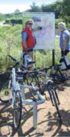
Radrastplatz Ockenheimer Straße

Die Radtour rund um Gau-Algesheim beginnt am Marktplatz bzw. Rathaus/Touristen-Information. Hier können Sie bereits am Anfang der Tour einer der schönsten Plätze der über 650 Jahre alten Stadt mit dem Rathaus und der kath. Kirche bewundern.