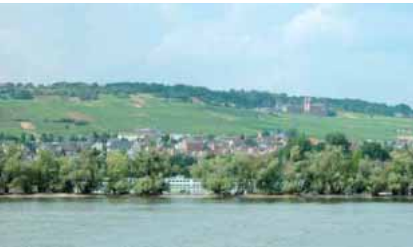
Rüdesheim am Rhein mit Kloster Eibingen