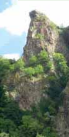
Blick auf den Rheingrafenstein bei Bad Münster an der Nahe

Die Tour startet am Gau-Algesheimer Rathaus/Marktplatz. Sie fahren wie in der Radtour Nr. 4 bzw. 7 beschrieben am Bahnhof vorbei auf den Radweg am Welzbach entlang nach Bingen-Gaulsheim über Bingen-Kempton bis Bingen Stadtzentrum an die Nahemündung.