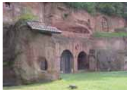
Felseneremitage bei Bretzenheim